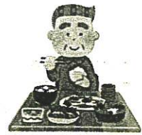
バランスのとれた食事