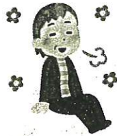
ストレスをためない