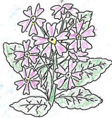
埼玉県の花 さくらそう

さいたま市田島ヶ原の自生地は今も昔ながらの面影を残し、国の特別天然記念物に指定されています。