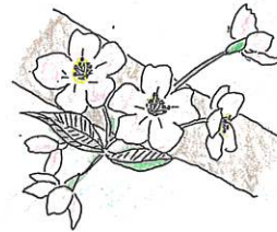
東京都の花 ソメイヨシノ

江戸時代の末期から明治にかけ、染井村（豊島区駒込付近）の植木職人が山桜の品種を改良して作りだしたそうです。