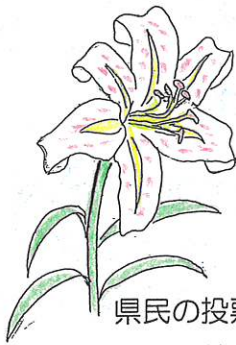
神奈川県の花 やまゆり