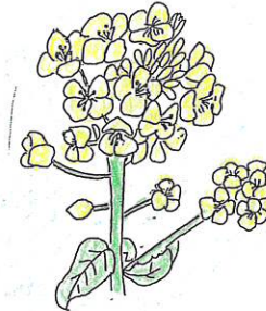
千葉県の花 なのはな

さいたま市田島ヶ原の自生地は今も昔ながらの面影を残し、国の特別天然記念物に指定されています。